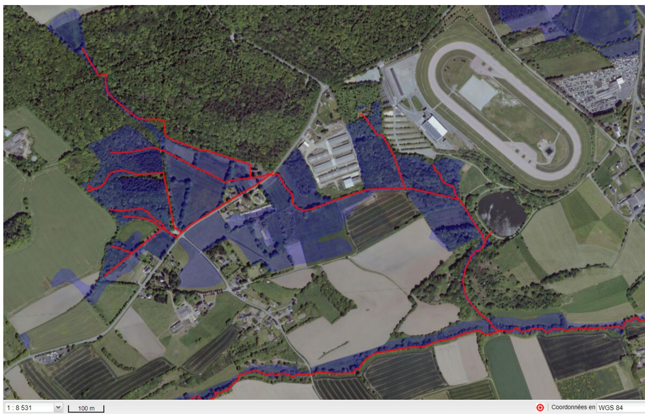
Extrait du visualiseur de la plate-forme Géobretagne : en bleu zones humides identifiées par le SAGE et cours d'eau avoisinants

dossier, qui peuvent être également sensibles à ces retombées (et contribuer par ailleurs à leur épuration, dans le contexte de la proximité avec une baie « algues vertes »).